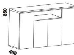
1470 komoda 4dveřová