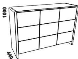
1500 komoda 3dveřová