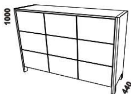
1500 komoda 3dveřová